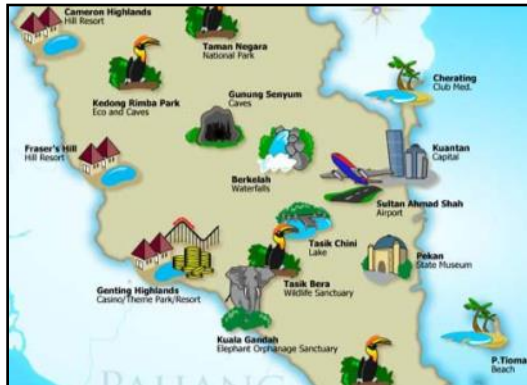
Peta Pelancongan Negeri Pahang Darul Makmur. Selamat Datang ke Negeri Tok Gajah.

بِسْمِ اللّٰهِ الرَّحْمٰنِ الرَّحِیْمِ السَّلَامُ عَلَیْكُمْ وَرَحْمَةُ اللّٰهِ وَبَرَکَاتُهُ